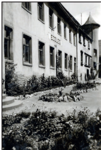
Le Cycle 03 à l'été 1954

La collectivité assure la gestion des trois bâtiments scolaires qui sont implantés sur le site du Schlossgarten. Le Cycle 01, bâtiment des classes de maternelles ouvert fin 2005. Le Cycle 02, bâtiment dont la toiture est végétalisée, a lui ouvert ses portes en 2013. Et le Cycle 03, le plus ancien bâtiment dispose d'une première partie construite au 17 ème siècle et une seconde partie construite en 1936. Chaque été, c'est l'heure des travaux de maintenance mais également de travaux d'investissement.